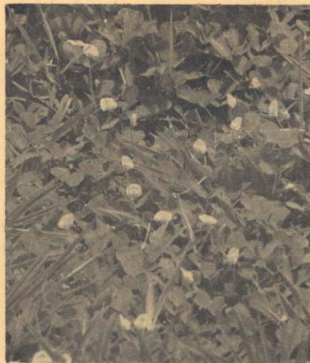
Figura 1. Asociación de A. pintoii con Brachiaria sp.

Con el propósito de ampliar el rango de especies compatibles con Brachiaria spp. adaptables a las condiciones de sabana y suelos ácidos, en 1976 y 1977 el Programa de Pastos Tropicales del CIAT introdujo 36 accesiones de siete especies de Arachis : A. Benthamii , A. duranensis , A. glabrata , A. monticola , A. pusilla , A. villosa , A. villosulicarpa . Estas accesiones, procedentes de la Universidad de Florida y del Departamento de Agricultura del estado de Georgia, Estados Unidos, resultaron muy susceptibles a un alto rango de enfermedades que normalmente afecta el cultivar Arachis hypogea ; un limitado número de ellas se probó en los Llanos pero ninguna sobrevivió.